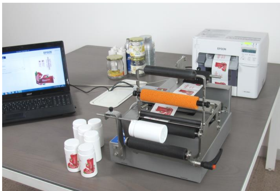
Pk-52 connesso a EPSON TM-C3500 stampa e applica etichette a colori con inchiostri resistenti a polimeri. Tutto in un solo passaggio, anche fronte/retro in piena autonomia.